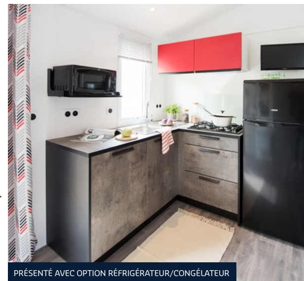
PRÉSENTÉ AVEC OPTION RÉFRIGÉRATEUR/CONGÉLATEUR