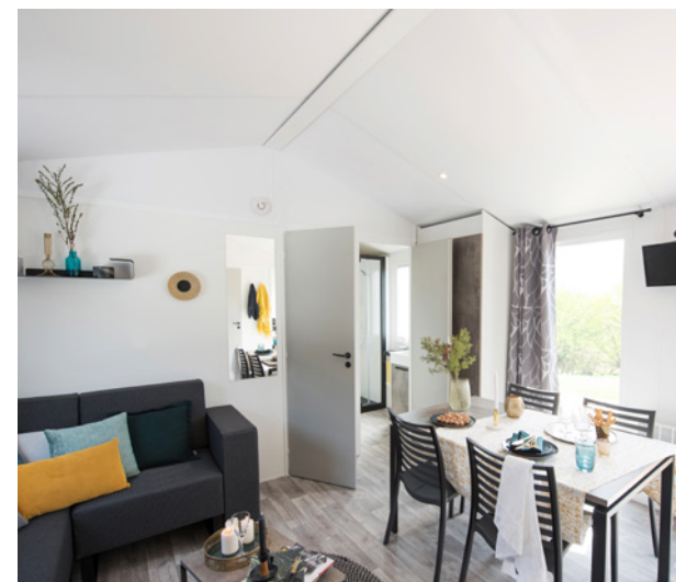
PRÉSENTÉ AVEC LES OPTIONS CANAPÉ PREMIUM ET CHAIRES DU PACK CONFORT+