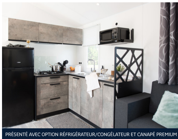
PRÉSENTÉ AVEC OPTION RÉFRIGÉRATEUR/CONGÉLATEUR ET CANAPÉ PREMIUM